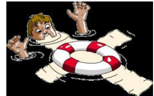
“La cruz salvavidas”