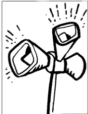
“La cruz del anuncio”

Dibuja una serie de cruces que tengan que ver con una situación o realidad concreta y que la resuma empleando los elementos simbólicos de esa realidad y la estructura esquemática de la cruz. Se han de dibujar los dos travesaños de la cruz mediante elementos que representen a la realidad a la que nos referimos. (“La cruz del estudiante”, por ejemplo, puede estar formada por dos libros; “La cruz del paro”, “La cruz del hambre”, “La cruz del amor”, “La cruz de la acogida”...).