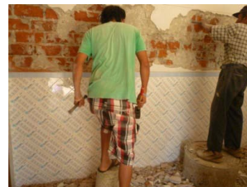
Reforma de los WC de la casita Maín. Piura. Perú. Curso 2012-2013.

En cuanto a la RIFA quisiera compartir con ustedes algunas ideas: