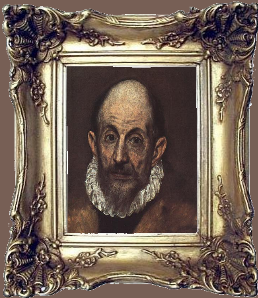
Doménicos Theotocópuli -Supuesto autorretrato-